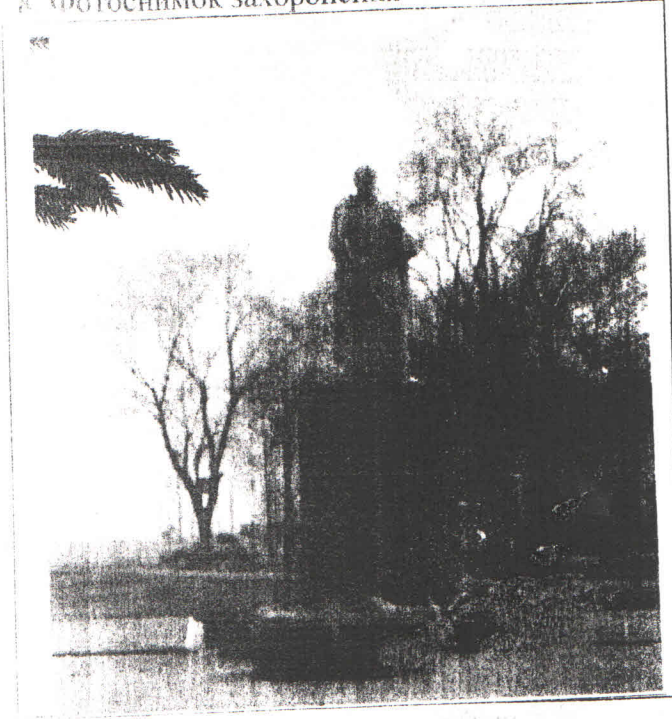
8. Фотоснимок захоронения